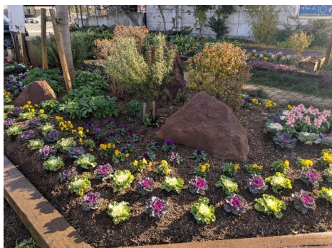
平野交差点東花壇