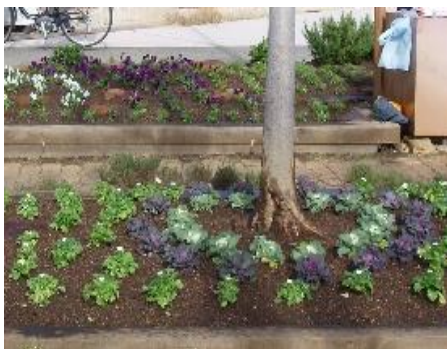
平野交差点西花壇