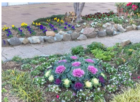
< 東側 >