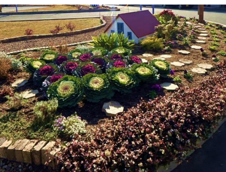
東加古川駅北花壇