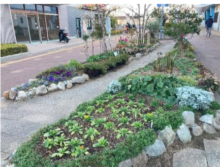
< 西側 >